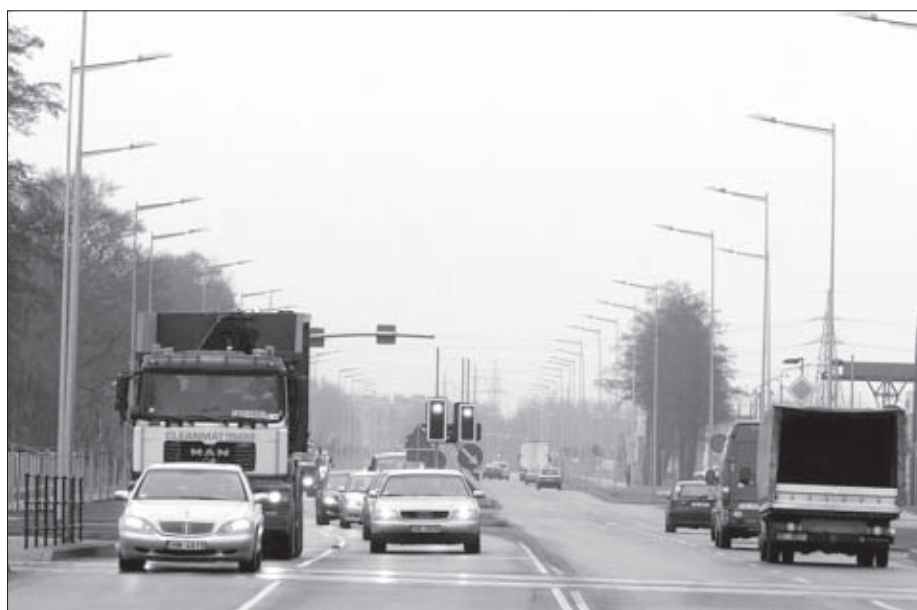
Papildus ES finansējumam pašvaldība piešķirusi arī līdzekļus 7000 latu apmērā sensoru ierīkošanai Brīvības ielas luksoforiem, lai autovadītājiem būtu ērtāk pārvietoties. Tos plānots uzstādīt līdz pavasarim.

Ir paredzēts veikt minēto ielu posmu seguma rekonstrukciju, gājēju/veloceliņa izbūvi, vairāku krustojumu un pieslēgumu rekonstrukciju, satiksmes organizācijas tehnisko līdzekļu uzstādīšanu, sabiedriskā transporta pieturvietu pārbūvi, lietusūdens kanalizācijas izbūvi, ielas apgaismojuma rekonstrukciju, pazemes komunikāciju aizsardzību, pārceļšanu; sadzīves kanalizācijas un ūdensapgādes izbūvi (inženierkomunikāciju izbūves izmaksas nav iekļautas projekta attiecināmās izmaksās, bet projekta kopējās izmaksās); apstādījumu izveidi; vides pieejamības nodrošināšanu.