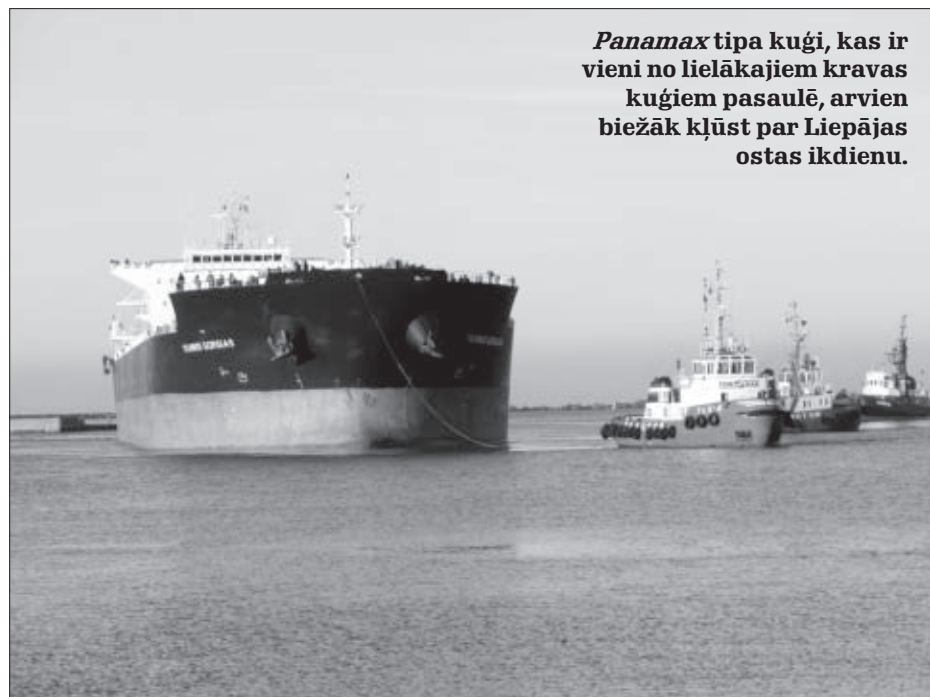
Panamax tipa kuģi, kas ir vieni no lielākajiem kravas kuģiem pasaulē, arvien biežāk kļūst par Liepājas ostas ikdienu.

kravu apgrozījuma pieaugumu devušas beramkravas, un tas saistīts ar ostas padziļināšanu un beramkravu termināļu paplašināšanu.