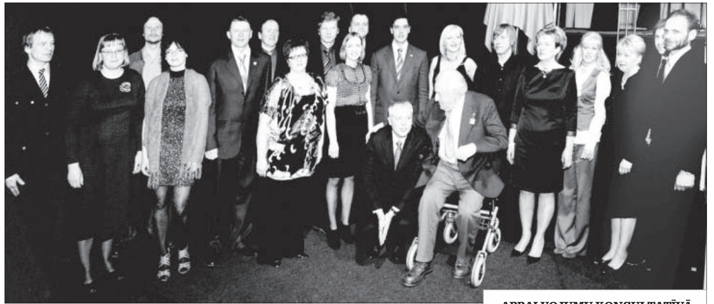
Goda un Gada liepājnieki 2011. gada 18. martā – pilsētas dzimšanas dienā – kopā ar Domes vadītājiem.