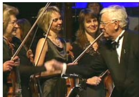
Raimonds Pauls savā jubilejas koncertā "Vētru un dzintara krastā".

5. janvārī tika paziņoti pretendenti uz "Mūzikas ierakstu Gada balvu – 2011", kuru pasniegs 28. februārī. Starp pieciem "Lat-